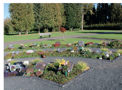
Erweiterung des Urnengrabfeldes auf dem Friedhof in der Kernstadt