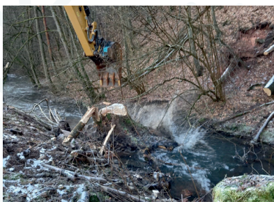
Entfernung von Bäumen und Bewuchs aus Fließgewässern zum Hochwasserschutz