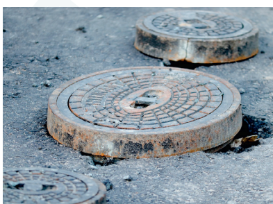
Erneuerung der Wasserleitung in der Leipziger Straße in Walburg