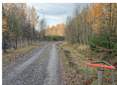
Freischnitt von Feldwegen auf einer Länge von ca. 50 km und Öffnung von Gräben auf einer Länge von ca. 7 km