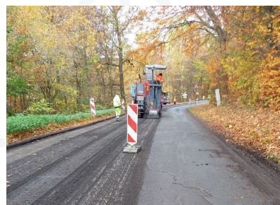
Erneuerung der Fahrbahndecke der Hirschhagener Straße